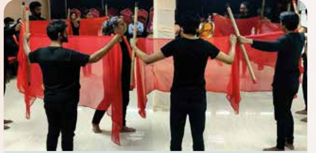
রবীন্দ্র সৃজনকলা বিশ্ববিদ্যালয়ে নাট্যকলা বিভাগের প্রথম ব্যাচের শিক্ষার্থীদের ব্যবহারিক পরীক্ষায় পরিবেশিত 'নুরলদীনের সারাজীবন'।