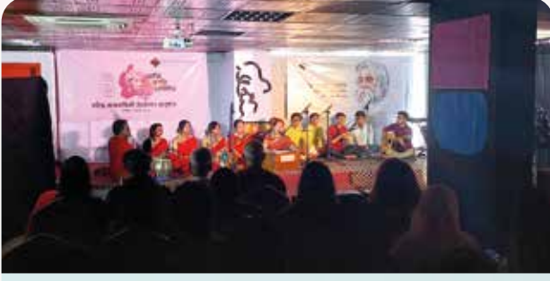
রবীন্দ্রজয়ন্তী উদযাপন অনুষ্ঠানে রবীন্দ্র সৃজনকলা বিশ্ববিদ্যালয়ের সংগীত বিভাগের পরিবেশনা।