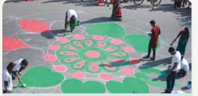
বিজয়ের সুবর্ণজয়ন্তীতে রবীন্দ্র সৃজনকলা বিশ্ববিদ্যালয় আলপনা কর্মসূচি 'আলপনায় আঁকি বিজয়ের ক্যানভাস'।