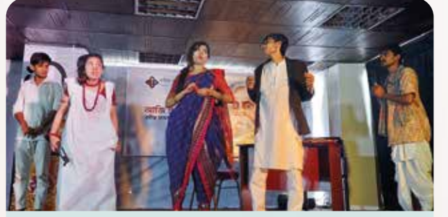
রবীন্দ্রজয়ন্তী উদযাপন অনুষ্ঠানে রবীন্দ্র সৃজনকলা বিশ্ববিদ্যালয়ের প্রথম ব্যাচের শিক্ষার্থীদের পরিবেশনায় রবীন্দ্র-নাটক 'খ্যাতির বিড়ম্বনা'।