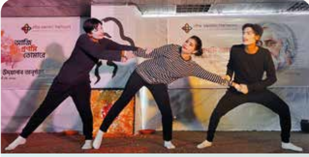
রবীন্দ্রজয়ন্তী উদযাপন অনুষ্ঠানে রবীন্দ্র সৃজনকলা বিশ্ববিদ্যালয়ের ১ম ব্যাচের শিক্ষার্থীদের রবীন্দ্র-নাটক 'তামের দেশ' অনুসরণে যুকাভিনয় পরিবেশনা।