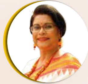
অধ্যাপক রেজওয়ানা চৌধুরী বন্যা প্রথিতযশা রবীন্দ্রসংগীত শিল্পী