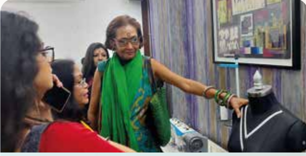
রবীন্দ্র সৃজনকলা বিশ্ববিদ্যালয়ের ক্যাম্পাস পরিদর্শনে আন্তর্জাতিক খ্যাতিসম্পন্ন ফ্যাশন আইকন ও ফ্যাশন ডিজাইন বিভাগের সাম্মানিক শিক্ষক বিবি রাসেলা।