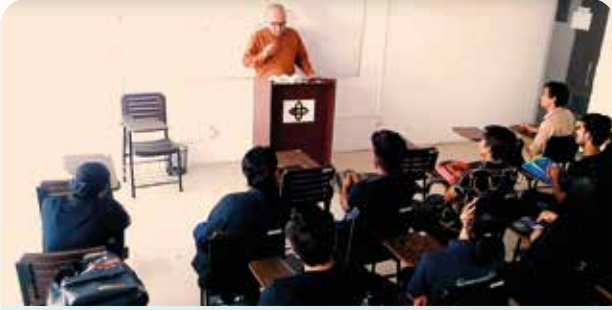
নাট্যকলা বিভাগের ক্লাস নিচ্ছেন প্রখ্যাত নাট্যব্যক্তিত্ব ও বিশ্ববিদ্যালয়ের নাট্যকলা বিভাগের সাম্মানিক শিক্ষক রামেন্দু মজুমদার।