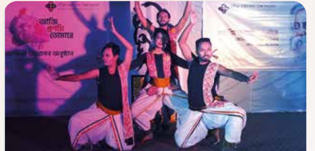
রবীন্দ্র সৃজনকলা বিশ্ববিদ্যালয় আয়োজিত ১৬৬তম রবীন্দ্রজয়ন্তী উদযাপন অনুষ্ঠানে নৃত্যকলা বিভাগের প্রথম ব্যাচের শিক্ষার্থীদের পরিবেশনা।