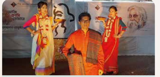
রবীন্দ্রজয়ন্তী উদযাপন অনুষ্ঠানে রবীন্দ্র সৃজনকলা বিশ্ববিদ্যালয়ের শিক্ষার্থীদের পরিবেশনায় বিশেষ 'ফ্যাশন শো'।