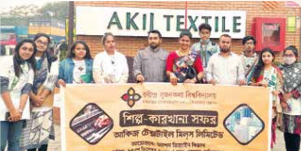
রবীন্দ্র সৃজনকলা বিশ্ববিদ্যালয়ের ফ্যাশন ডিজাইন বিভাগের প্রথম ব্যাচের শিক্ষার্থীদের মানিকগঞ্জের গোলড়ায় অবস্থিত আকিজ টেক্সটাইল মিলস পরিদর্শন।